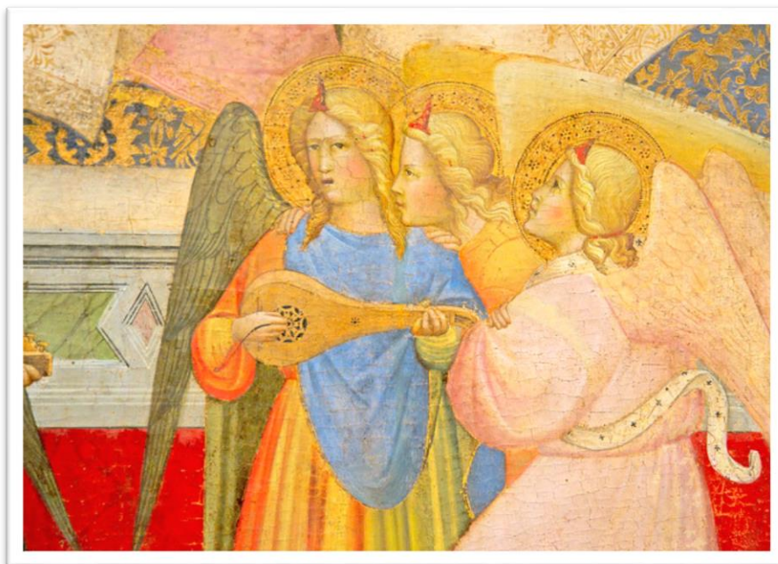
Agnolo Gaddi, Koronacja Maryji Dziewicy z sześcioma aniołami , ok. 1370, Narodowa Galeria Sztuki w Waszyngtonie.

lutnicze Półwyspu Apenińskiego wytwarzały także mandoliny. Tuż przed 1900 r. powstała w Ameryce mandolina płaska, obecnie najpopularniejsza.