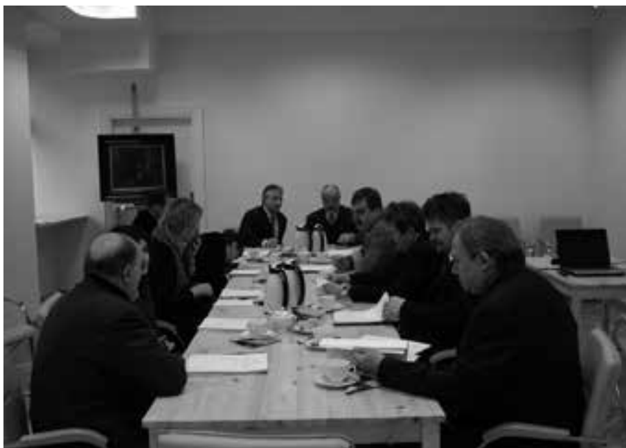
1. Inauguracyjne posiedzenie Rady Muzeum Historii Kielc, 14 II 2007 r.