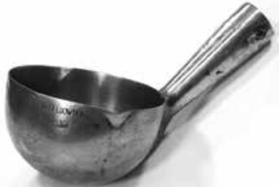
10. Chochła wojskowa, wyrób „Huty Ludwików”, 1939 r., nr inw. MHKi/H/140

nia”, wyrób Kieleckich Zakładów Wyrobów Metalowych „SHL” z lat sześćdziesiątych ubiegłego wieku.