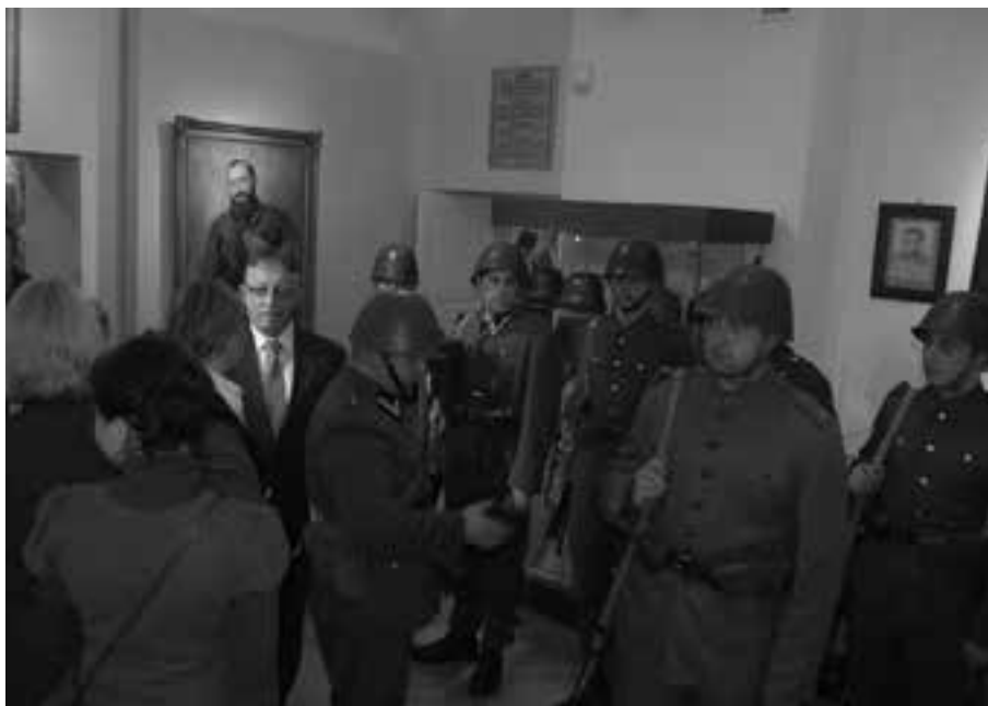
4. Otwarcie wystawy „Przystanek Niepodległość”, 7 VI 2008 r.