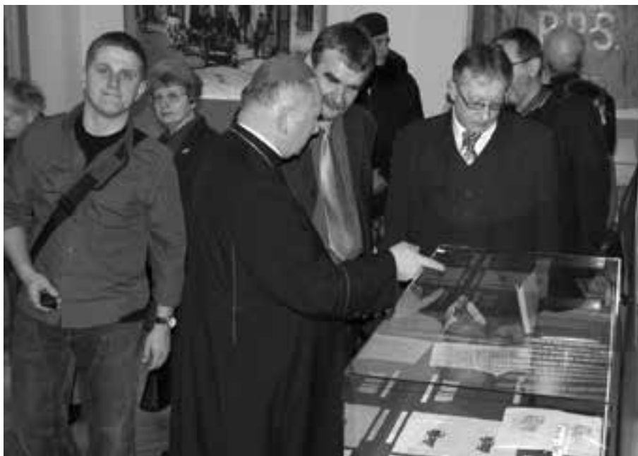
2. Otwarcie Muzeum Historii Kielc, 1 II 2008 r.