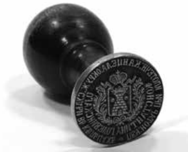
4. Tłok pieczętny kieleckiego notariusza Konstantego Holewińskiego, XIX w., nr inw. MHKi/H/133