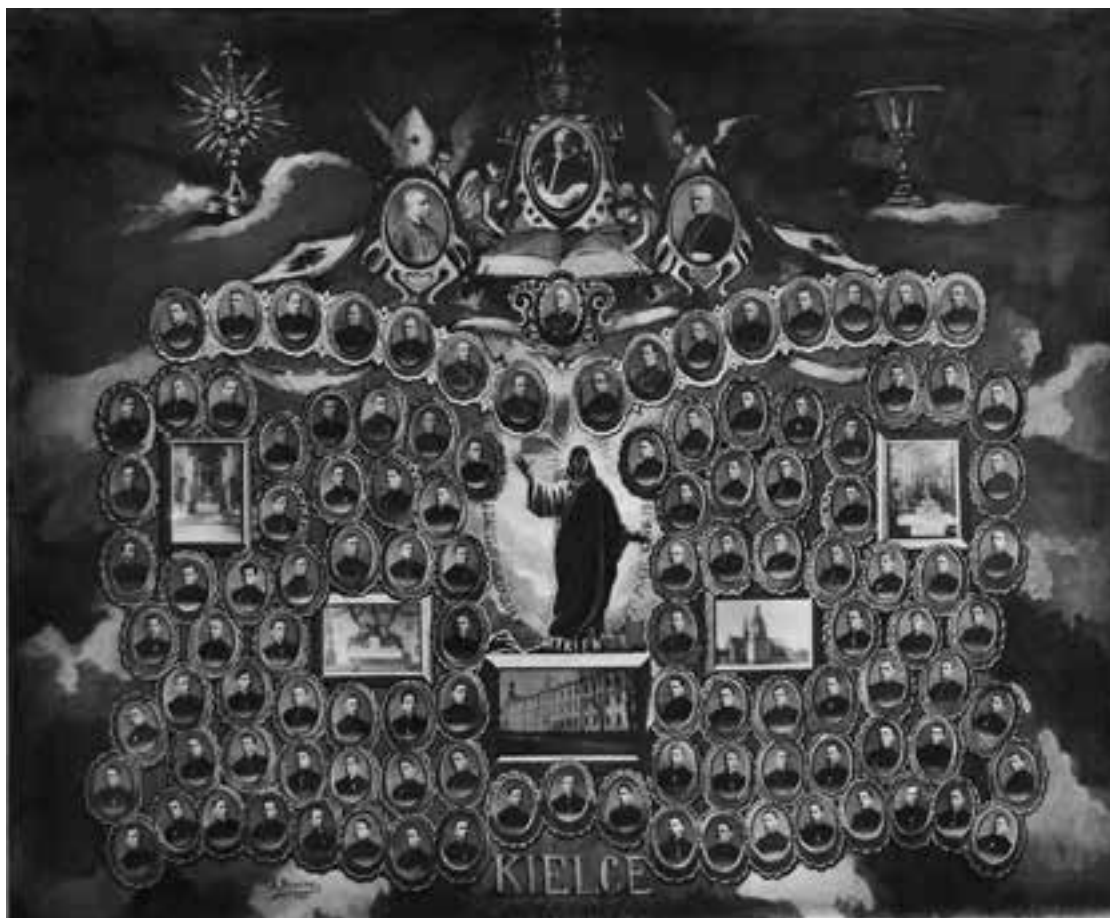
8. Tableau Seminarium Duchownego w Kielcach, 1920 - 1925, nr inw. MHKi/H/132