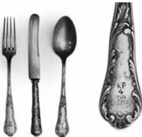
12. Sztućce z kasyna podoficerskiego 4. Pułku Piechoty Legionów w Kielcach, druga połowa lat 30. XX w., nr inw. MHKi/H/276-8