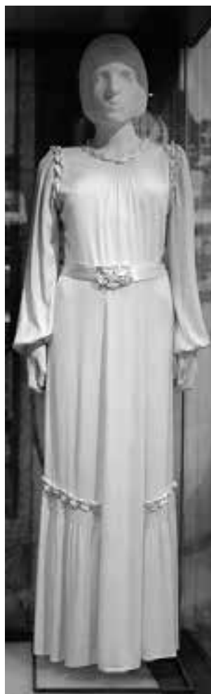
13. Suknia ślubna, 1936 r., nr inw. MHKi/H/236

podoficerskim 4. Pułku Piechoty Legionów, o czym informuje puncowany napis: K. P. 4 P.P.LEG . Sztućce pochodzą prawdopodobnie z zestawu ofiarowanego kasynu w latach trzydziestych przez prezydenta Kielc Stefana Artwińskiego. Funkcję pamiątkową ma także złożona puszka na tytoń z wygrawerowaną inskrypcją: II Nagroda / Reduta Zw. Of. Rez. / Kielce 21/III 1928 .