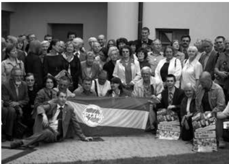
3. Otwarcie wystawy „100 lat PTK – PTTK w Kielcach, 15 V 2008 r.