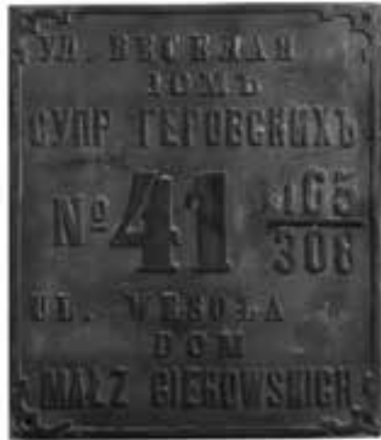
9. Tablica żelazna z domu Gierowskich, początek XX w., nr inw. MHKi/H/273