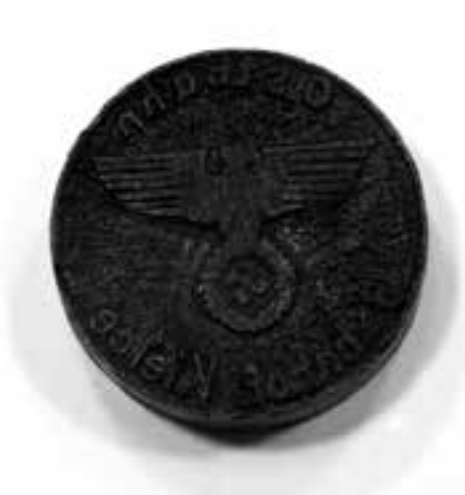
5. Tłok pieczętny z kieleckiego dworca kolejowego, okres II wojny światowej nr inw. MHKi/H/216