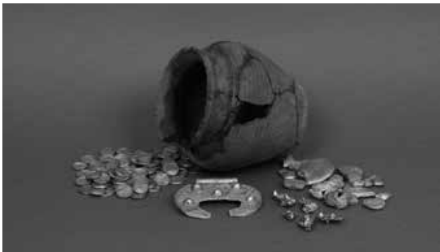
2. Skarb srebrny z Małogoszcza, XI w., nr inw. MHKi/H/124

Kolejną grupę muzealiów stanowią archiwalia: dokumenty, druki, listy ukazujące życie społeczne, gospodarcze i polityczne Kielc. Ramy czasowe sięgają od pierwszej połowy XIX po schyłek XX w. Spośród zróżnicowanego zbioru warto wymienić kilka najciekawszych eksponatów.