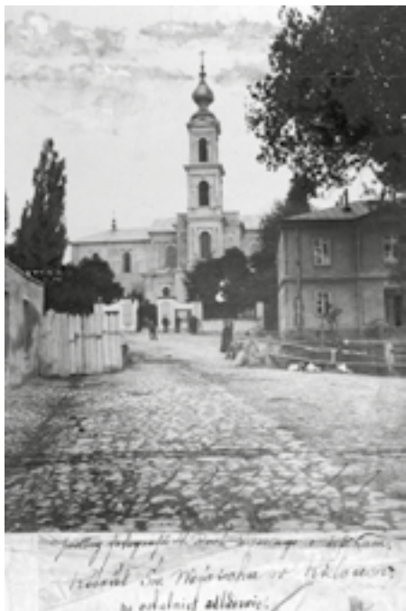
Kościół ś. Wojciecha – fotografia z rękopisu „Pamiętnik Kielecki. Zbiór prac ku uczczeniu Adama Mickiewicza (1798–1898)”, przed 1900 r.

Polskich w Kielcach. Są to zdjęcia grupowe członków związku oraz zapis uroczystości poświęcenia sztandaru w 1933 r.