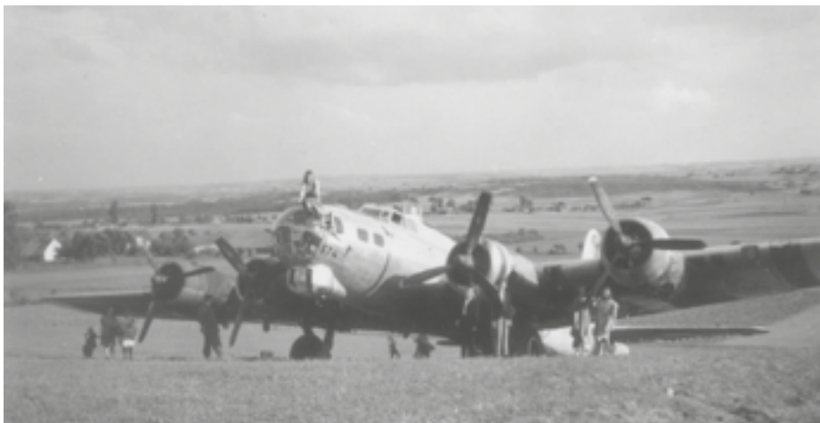
Grupa młodych ludzi pozująca przy amerykańskim bombowcu, podczas pikniku w miejscowości Zgórsko koło Kielc. Wiosna 1945 r.

miały być polisą ubezpieczeniową w wypadku niepowodzenia programu rozwojowego konstrukcji Boeing'a 4 .