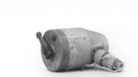
Mechanizm sterowania zaworu nadmiarowego dołotu powietrza do turbosprężarki silnika Wright R-1820-97