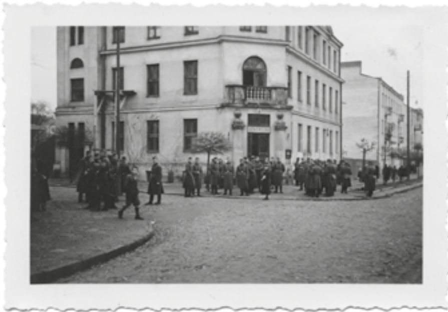
Żołnierze niemieccy przed budynkiem łaźni na ul. Staszica, ok. 1940 r.

cech charakterystycznych twarzy. Czasem fotografie zachowywały jeszcze walory artystyczne, zazwyczaj jednak były ich pozbawione, zbliżone swym charakterem do zdjęcia legitymacyjnego.