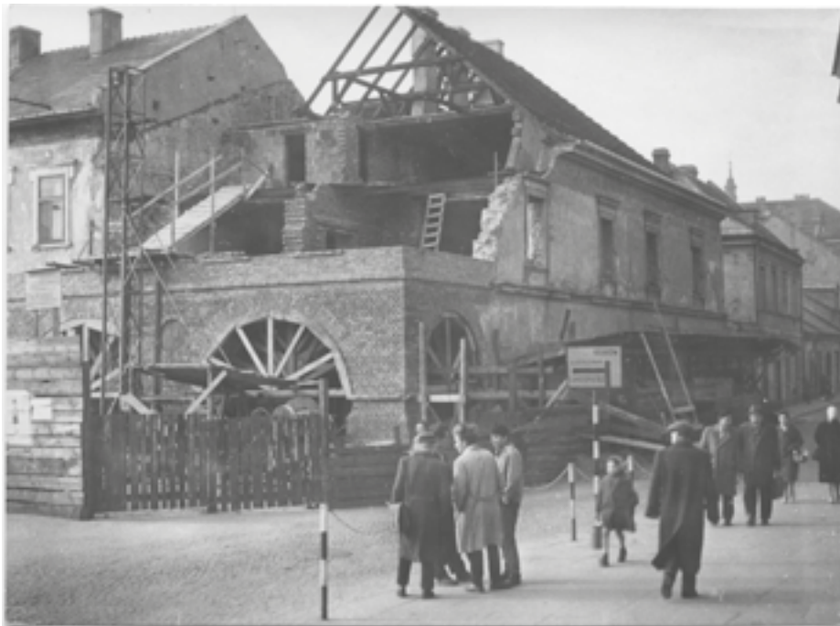
Remont kamienicy Sołtyków, 1961 r., fot. Jerzy Kamoda

datowanie, wymiary, tworzywo (nośnik), stan zachowania, wartość, bibliografia, sposób nabycia i miejsce przechowywania.