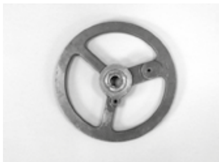
Element centralnej konsoli

szynowych (ckm) Browning. Maksymalny ładunek bomb wynosił 7983 kg. Załoga składała się z 10 osób 1 .