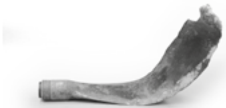
Łopata śmigła radzieckiego samolotu transportowego Lisunow Li-2