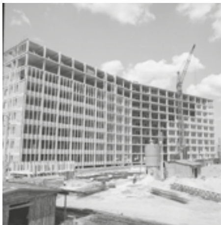
Budowa siedziby Wojewódzkiej Rady Narodowej, 1968 r.

stycznej „RAFAEL” (Warszawa), Waław Saryusz Wolski (Warszawie), „St. Stadler dawniej B. Henner” (Kraków), „George” (Kraków), Władysław Gargul (Wieliczka), „Studio” (Kraków).