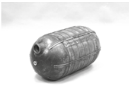
Bezodpryskowy aluminiowy zbiornik tlenu