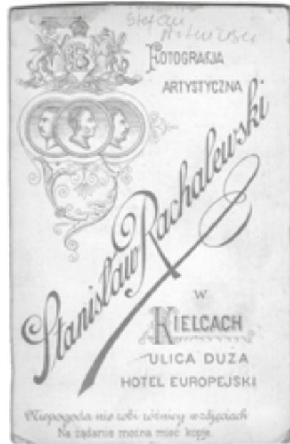
Rewers fotografii z ozdobną winiętą z zakładu fotograficznego Stanisława Rachalewskiego przy ul. Dużej, pocz. XX w.

VI Kieleckiej Drużyny Harcerskiej. Zawiera on 24 fotografie, m.in. z uroczystości poświęcenia sztandaru drużyny przez biskupa Czesława Kaczmarka.