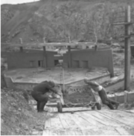
Budowa amfiteatru na Kadzielni, 1970 r.