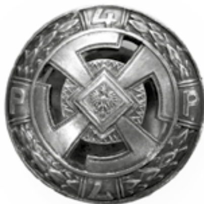
Odznaka 4 Pułku Piechoty Leg. wz. 4, lata 1928-1939.

(mecz drużyn piłkarskich siódemek w 1945 r.) czy też z kieleckich ulic (przechodnie na ul. Sienkiewicza pomiędzy Silnicą a ul. Staszica). Wśród nich znajduje się zespół 6 fotografii ukazujących mieszkańców Kielc i okolicznych miejscowości oraz żołnierzy niemieckich w czasie targu na Placu Wolności zimą 1939/40 r.