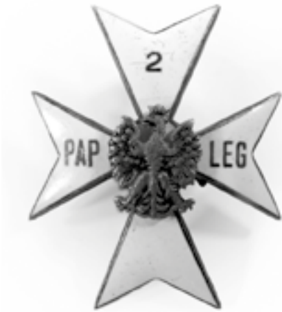
Odznaka 2 Pułku Artylerii Polowej Leg., lata 1929-1931

wz. 38 (produkowane w kieleckiej Hucie „Ludwików”).