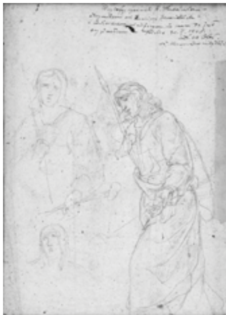
Studia do obrazu „Ukrzyżowanie Chrystusa”, rys. Rafała Hadziewicza, lata 1871–1883.