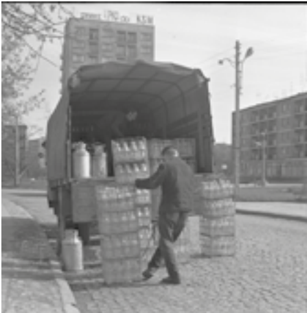
Dostawa mleka na ul. Żródlowej, lata 70-te XX w.

pozytywu. Przyjmując powyższe zastrzeżenie oraz cezurę obu wojen światowych, podział chronologiczny fotografii w Muzeum Historii Kielc przedstawia się następująco: zbiór fotografii dziewiętnastowiecznych i z początku XX w. (do 1914 r.) liczy 44 egz., z lat 1914–1918 – 84 egz., z okresu międzywojennego – blisko 1000 egz., z okresu okupacji – 24 egz., z lat 1945–1989 ponad 600 egz., po 1989 r. około 200 egz.