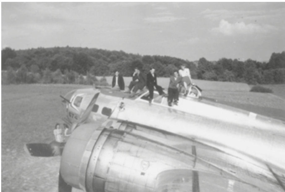
Widok przedniej części bombowca Boeing B-17 G, stojącego na polu w miejscowości Zgórsko. Wiosna 1945 r.

radiowym numerem wywoławczym samolotu „46674” 26 . Samolot lądował z otwartym podwoziem, które nie uległo złamaniu podczas zetknięcia z nieutwardzonym gruntem. Widoczne są uszkodzenia – brak poszycia części lewego statecznika poziomego oraz zagłębiona w ziemię dolna wieżyczka strzelecka Sperry.