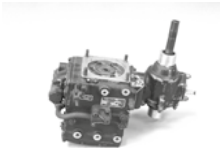
Przekładnia napędu podkadłubowej, kulistej, obrotowej wieżyczki strzeleckiej Sperry, tzw. „ball turret

nej 1 listopada 1943 r. 15 Armii. Początkowo 15 Armia stacjonowała w Afryce Północnej, a jej zadaniem było prowadzenie nalotów na cele w faszystowskich Włoszech, okupowanych Bałkanach czy południowej Francji. Dosyć szybko samoloty 15 Armii dosięgły obszaru III Rzeszy, ściśle Austrii i południowych Niemiec. Po udanym lądowaniu aliantów na Sycylii oraz zdobyciu przyczółków w południowych Włoszech samoloty 15 Armii przeniosły się do zlokalizowanych tam baz 14 . Wiosną 1945 r. U.S.A.A.F. posiadała w Europie 2300 „Latających Fortec” w składzie 8 Armii Powietrznej i 500 w składzie 15 Armii. Ostatni B-17 G z serii liczącej 8680 egzemplarzy zszedł z linii produkcyjnej już po zakończeniu działań wojennych w Europie 29 lipca 1945 r. 15 . Bombowców B-17 G używano także w RAF pod oznaczeniem Fortress Mk III.