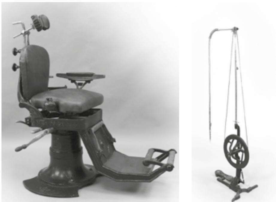
Fotel dentystyczny, ok. poł. XX w. Po prawej: maszyna do borowania zębów o napędzie nożnym z gabinetu dentystycznego Mieczysława Zwolińskiego przy ul. Hipotecznej 14, lata 30-te XX w.

Śladem aktywności fizycznej mieszkańców Kielc są ofiarowane muzeum dwie pary drewnianych nart (zjazdowe i biegowe), bambusowe kijki, dwie pary skórzanych butów narciarskich oraz smar do nart „Włazol”.