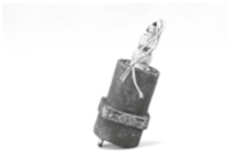
Nadajnik kąta wychylenia klap skrzydłowych