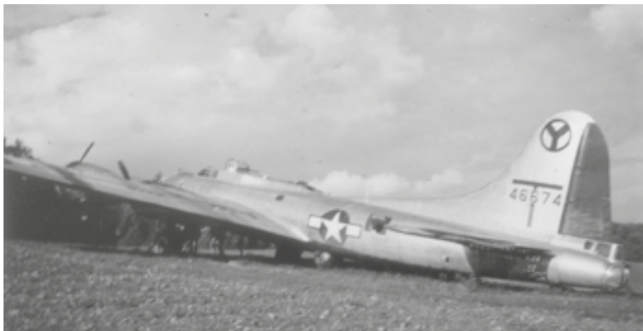
Samolot B-17 G nr 44-6674. Widoczne uszkodzenia lewego statecznika poziomego.

ści zajętej już wówczas przez Armię Czerwoną, położonej z dala od linii frontu i odpowiednich dla tak dużego samolotu lotnisk.