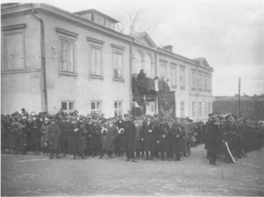
Uroczystości poświęcenia sztandaru kieleckiego oddziału Związku Kolejowców Polskich, 1933 r.