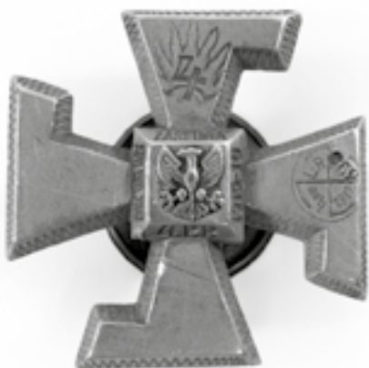
Odznaka 4 Pułku Piechoty Leg. wz. 2, lata 1917-1919