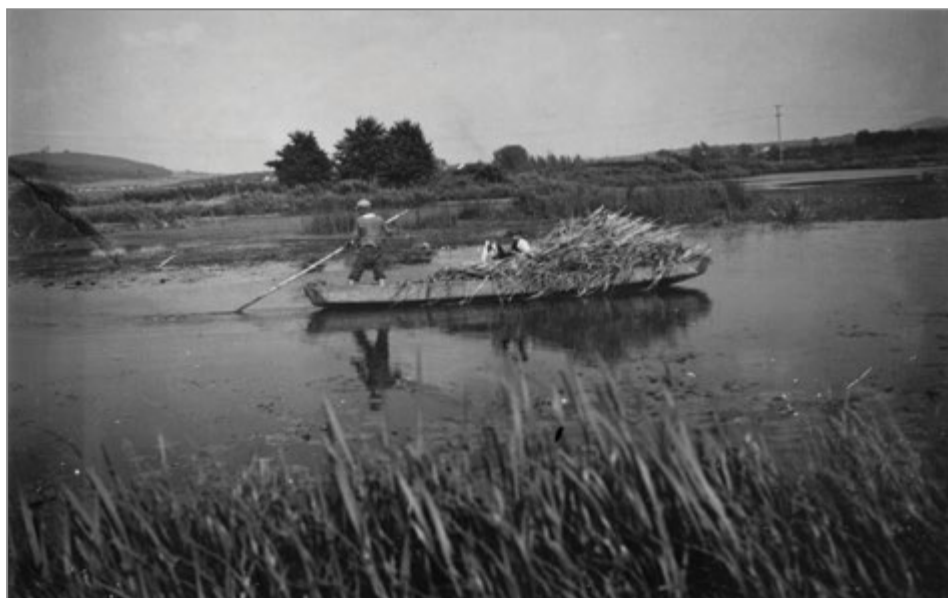
14. Białogon, październik 1937 r.