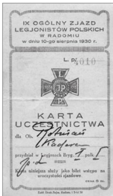
6. Bilet wstępu na IX Ogólny Zjazd Legionistów Polskich, 1930 r.