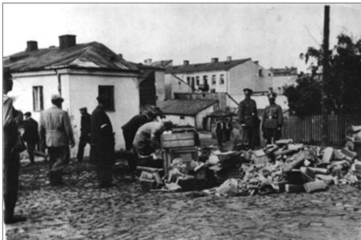
12. Zagłada getta. Zrabowane mienie żydowskie złożone na placu św. Wojciecha, 1942 r.

św. Wojciecha – wówczas Adalbertplatz 79 . Zrujnowana przez Niemców synagoga przy ul. Warszawskiej pokazana jest na dwóch fotografiach (od strony wschodniej i od strony zachodniej) 80 .