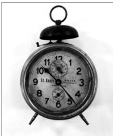
3. Budzik z zakładu zegarmistrzowskiego Sz. Kanera, lata trzydzieste XX w.