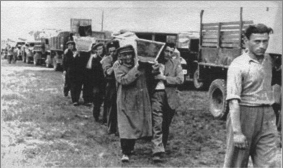
Funeral procession for victims of Kielce Pogrom. Кельце. После еврейского погрома.