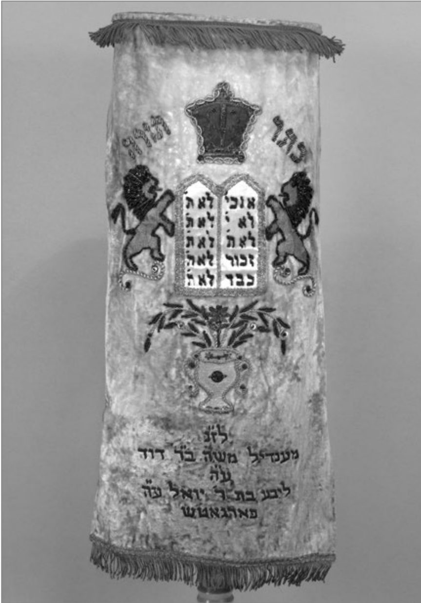
1. Sukienka na Torę, lata trzydzieste XX w.