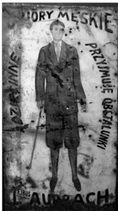
5. Szyld ze sklepu z ubraniami i zakładu krawieckiego Lejbusia Aurbacha, lata trzydzieste XX w.