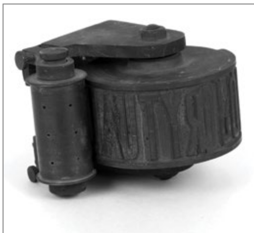
2. Pieczęć do oznaczania mięsa z uboju rytualnego, około 1936 r.