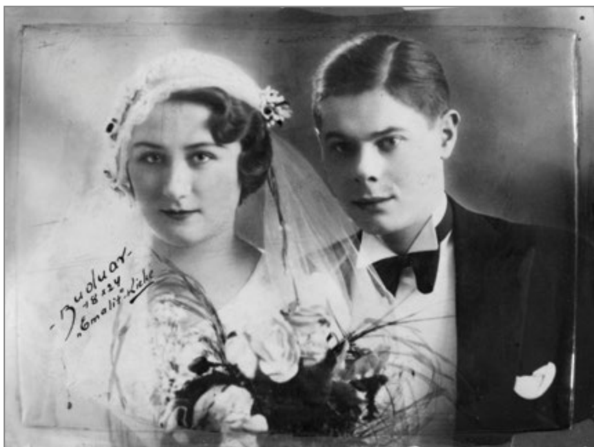
9. Kolorowany portret ślubny (monidło) z zakładu portretowego „Emalit” Kopia Grin-grasa i Izaaka Obarzańskiego, lata trzydzieste XX w.