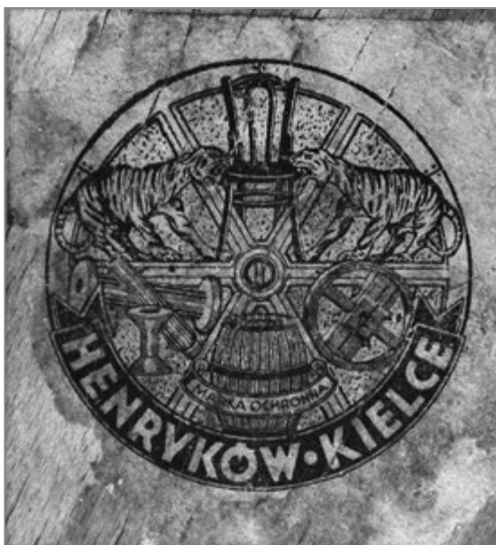
4. Krzesło z fabryki mebli giętych „Henryków” wraz z papierową etykietą zakładu, lata trzydzieste XX w.