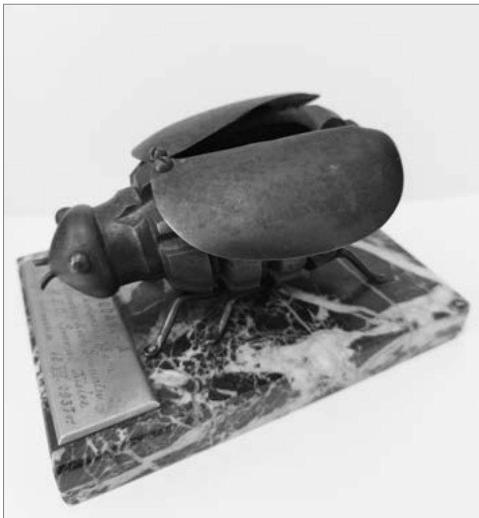
8. Popielniczka w formie owada na marmurowej podstawie – nagroda Klubu Sportowo-Oświatowego Granat Kielce w biegu kolarskim, 1937 r.