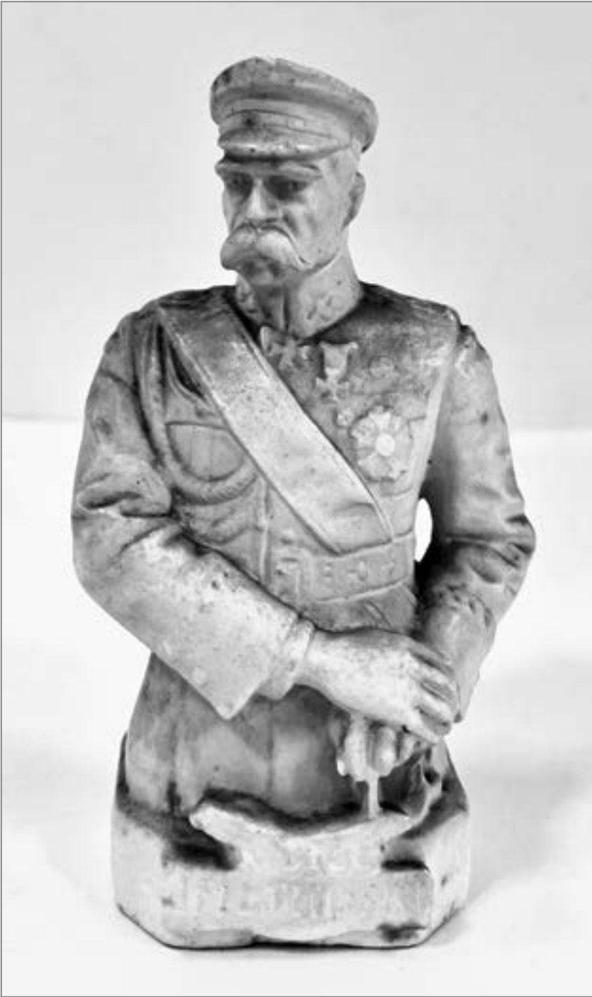
7. Statuetka Józefa Piłsudskiego z Artystycznej Wytwórni Figur w Częstochowie, proj. S. Kozikowski, 1935 r.