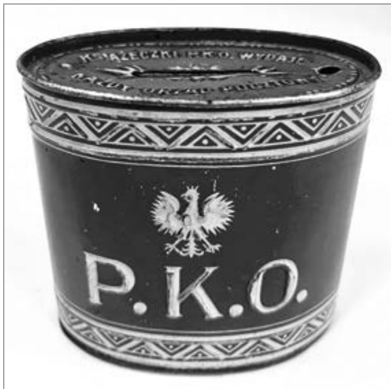
11. Skarbonka Pocztovej Kasy Oszczędności, lata 20. XX w.