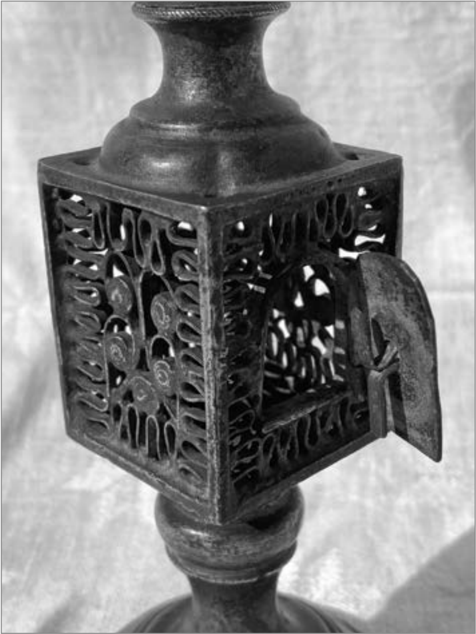
9. Fragment balsaminki, koniec XIX w.