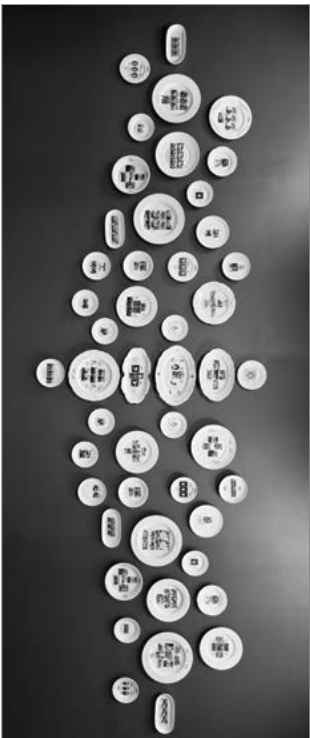
6. Instalacja artystyczna Marka Cecudy pt. Zatrzymany czas , 2022 r.