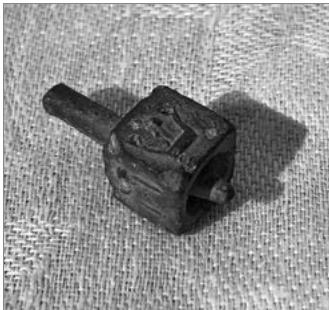
10. Dreidel, początek XX w.